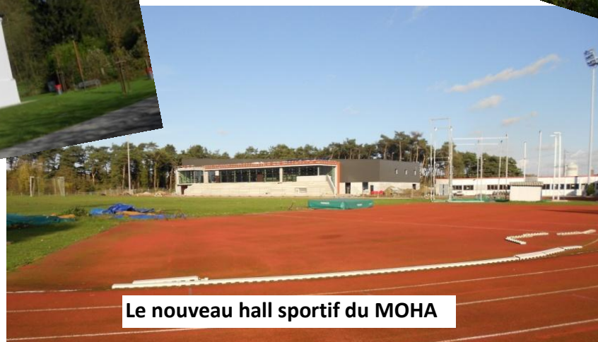
Le nouveau hall sportif du MOHA