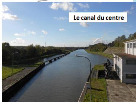
Le canal du centre

Ce sont des écoles de qualité pour l'éducation de nos enfants, des clubs d'athlétisme et de football pour nous garder en forme. Et n'oublions pas la Maison de la Biodiversité qui est un lieu d'apprentissage et d'épanouissement.