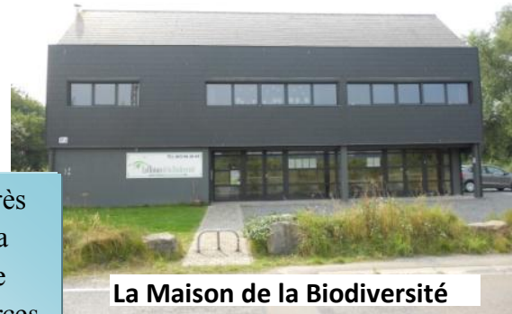
La Maison de la Biodiversité

Vivre à Obourg c'est vivre avec une très grande qualité de vie. C'est vivre à la campagne tout en étant proche d'une grande ville. Ce sont des petits commerces de proximité qui nous rendent bien service.