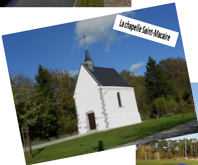
La chapelle Saint-Macaire